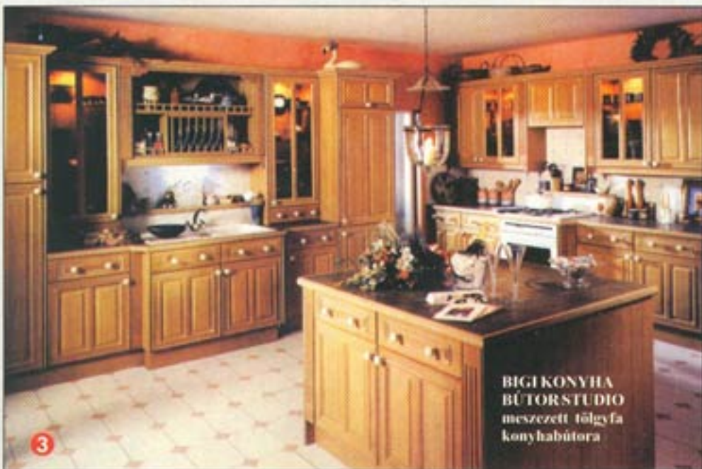
BIGI KONYHA BÚTORSTUDIO meszesett tölgyfa konyhabútor

A következő 2 képünkön pácolással felületkezelt tömör diófából készült