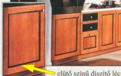
elütő színű díszítő lécc

bútort, érdekes profil kialakítása teszi egyedivé. Meghökkenítő a leleményesség, mellyel a megmunkálás során nemcsak "elvesz" a profilból, hanem egy elütő színű díszítő léccel "hozzátesz" a front felületéhez. Finom vonalvezetése és egyszerű eleganciája alkalmassá teszi akár egy modern, akár egy stíl jellegű enteriőr berendezésére is.