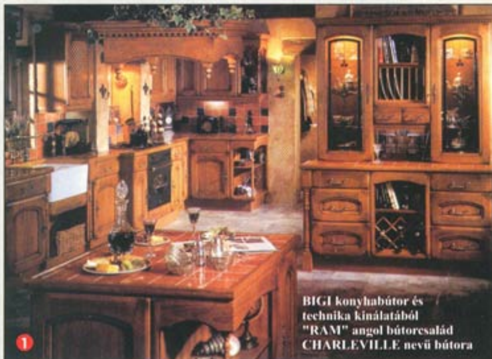
BIGI konyhabútor és technika kínálatából "RAM" angol bútorcsalád CHARLEVILLE nevű bútor

Sorozatunk első részében a konyhabútor kiválasztásához adtunk praktikus tanácsokat, bemutatva az ajtófrontok széles szín és formavilágát, jellemző méreteit.