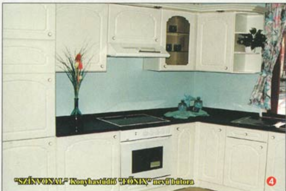
"SZÍNVONAL" Konyhastúdió "FONIX" nevű bútor

Következő számunkban a nappali szoba lesz "terítéken".